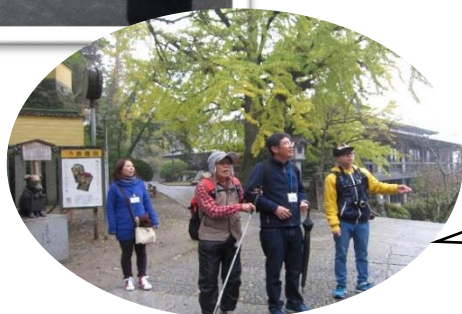
金比羅参拝への同行