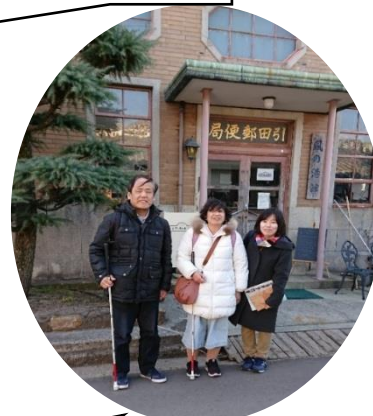
旅行への同行ボランティア